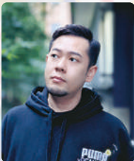
作曲・編曲 山邊 光二