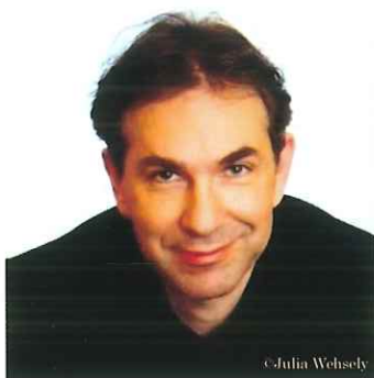
クリストファー・ヒンターフーバー ピアノ ウィーン国立音楽大学教授