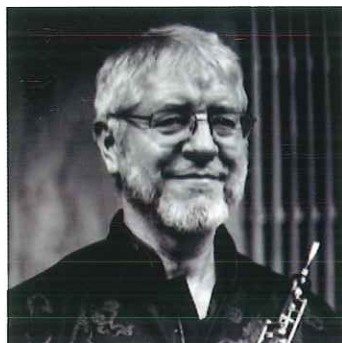
トーマス・インデアミュエレ オーボエ エコール・ノルマル音楽院教授 アヴォス・プロジェクト教授 元カールスルーエ音楽大学教授