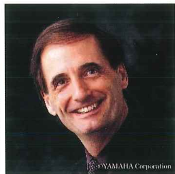
ディーター・フルーリー フルート 元ウィーン・フィルハーモニー管弦楽団 元グラーツ国立音楽大学教授