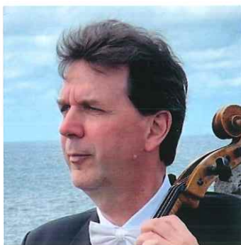
タマーシュ・ヴァルガ チェロ ウィーン・フィルハーモニー管弦楽団