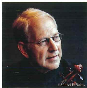
シュロモ・ミンツ ヴァイオリン