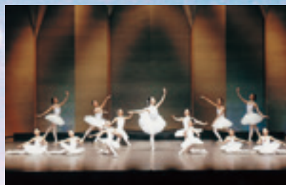
桐生洋舞連盟 (クラシックバレエ)

入場料 全席自由 一般 1,000円 学生 500円 (未就学児入場不可) 当日徴収 但し、往復はがき(1枚につき一人)による事前予約制となります。 住所、氏名、電話番号を記載の上、お申込みください。 受付開始日：10月15日(金)～(定員になり次第締め切り)