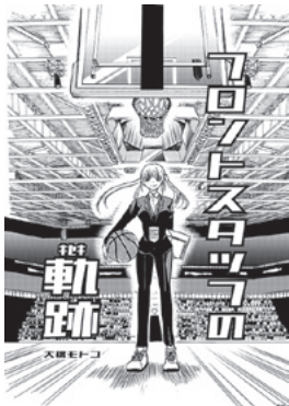
マンガ部門 最高賞・大賞(一般) 「フロントスタッフの軌跡」 大橋モトコ