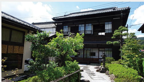
▲会場「四辻の齋嘉」外観（旧斎藤織物の母屋）