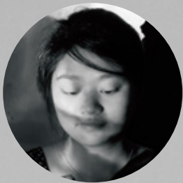
江上越（現代美術） ETSU EGAMI

本展では、5人のアーティストが県内レジデンスでの経験を元に完成させた成果作品を紹介します。アーティストは、私たちが普段気づかないような、その土地の歴史や文化、自然環境、物語に触発され、また地域の人々との交流から刺激、アイデア、インスピレーションを得て作品を制作しています。それぞれの滞在場所や時間、環境を越えて、アーティストの視点から表現される群馬の魅力と、柔軟な発想で作りあげられたアート作品との出会いをお楽しみください。